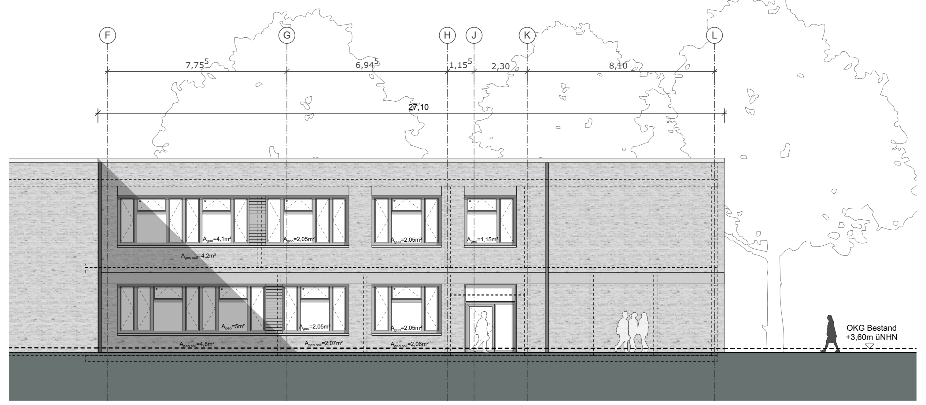
Fachklassentrakt Ansicht Süd, M 1:100